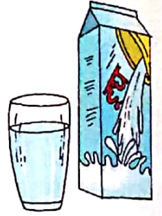
मापने के शब्द लीटर, मिलीलीटर