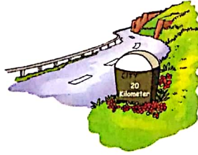
नापने के शब्द मीटर, किलोमीटर