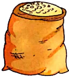
तोलने के शब्द किलो, ग्राम, टन